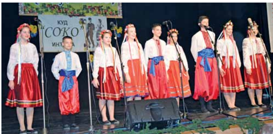
Дитяча танцювальна група УКМТ «Калина»