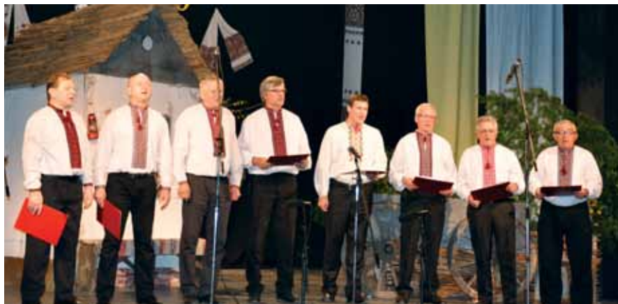
Чоловіча вокальна група КМТ ім. Івана Сенюка (Кула)