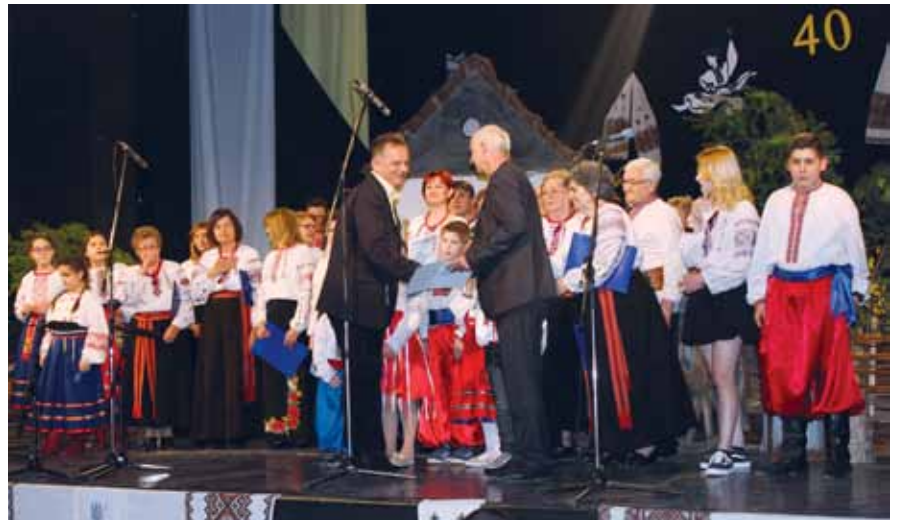
Урочисте відзначення з нагоди 40-річчя діяльності ТПУК «Коломийка»

У мистецькій програмі виступила дитяча вокальна група, джерельна співоча група, мішана вокальна