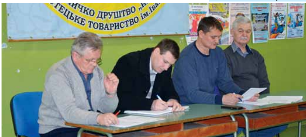
Річні звітно-виборчі збори КМТ ім. Івана Сенюка