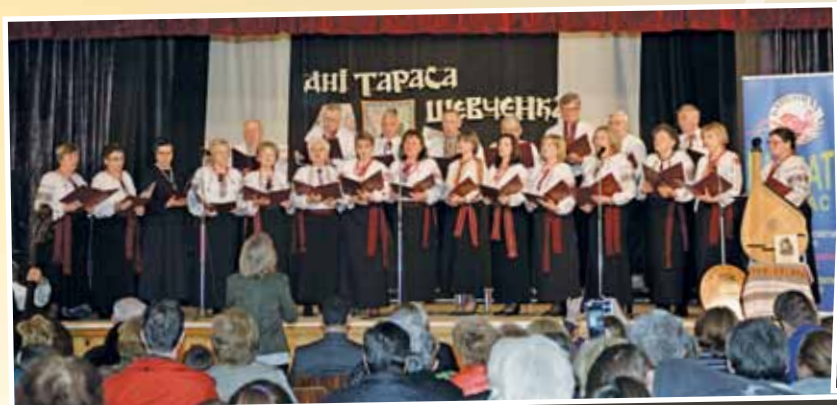
Хор КПТ «Карпати»