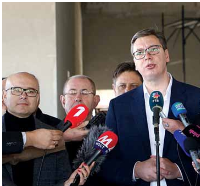
Председник Србије Александар Вучић обишао је радове на изградњи нове зграде Радио-Телевизије Војводине

Прва фаза радова на изградњи нове зграде војвођанског јавног сервиса је завршена, у току је