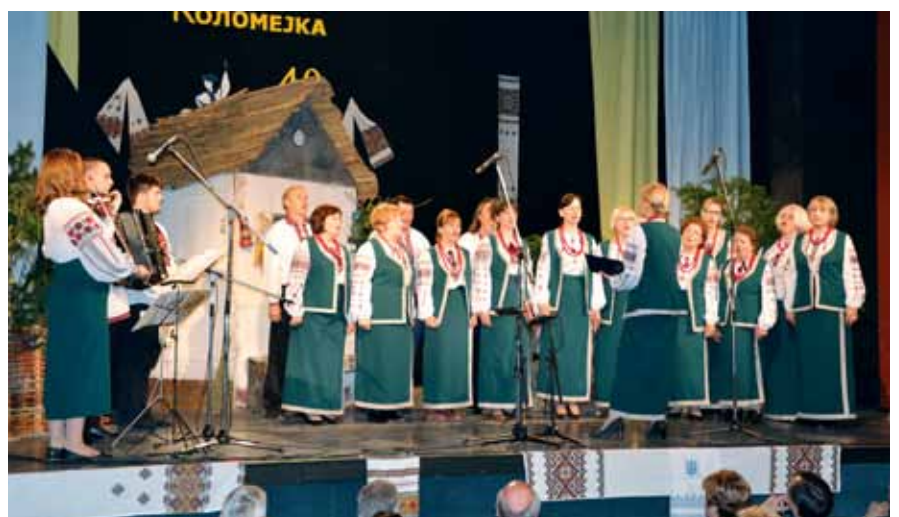
Мішана вокальна група УКЦ «Кобзар» (Новий Сад)