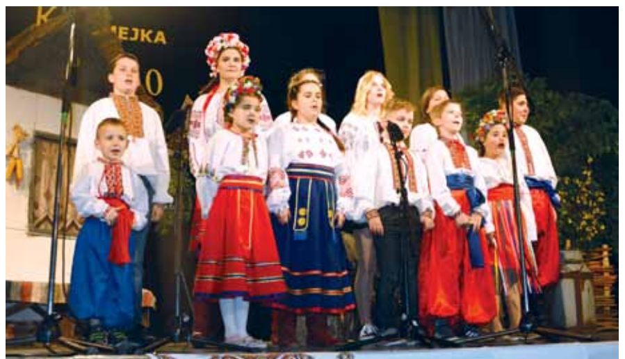
Дитяча вокальна група ТПУК «Коломийка» (Сремська Мітровіца)