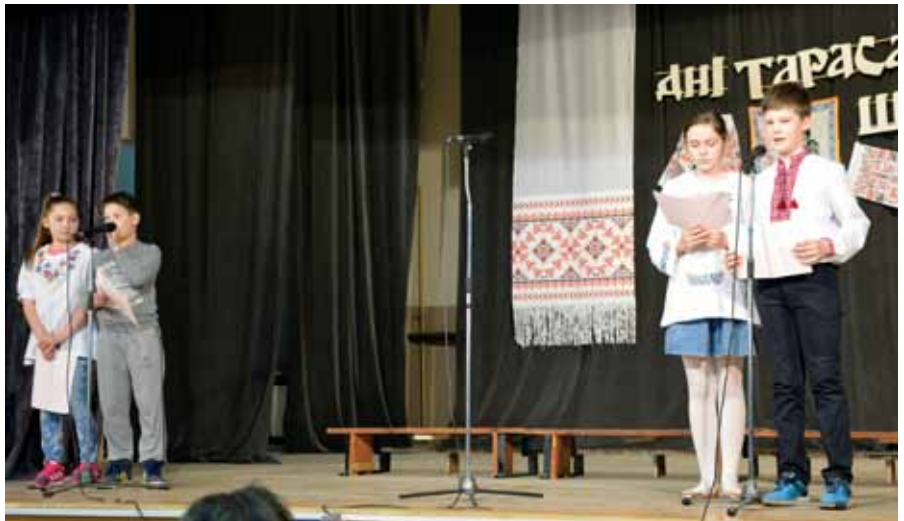
Діти, які вивчають українську мову в початкових школах Вербасу