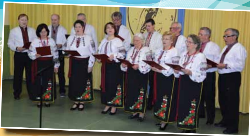
Мішана вокальна група КМТ ім. Івана Сенюка