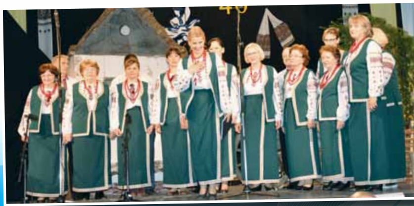
Мішана вокальна група УКЦ «Кобзар»