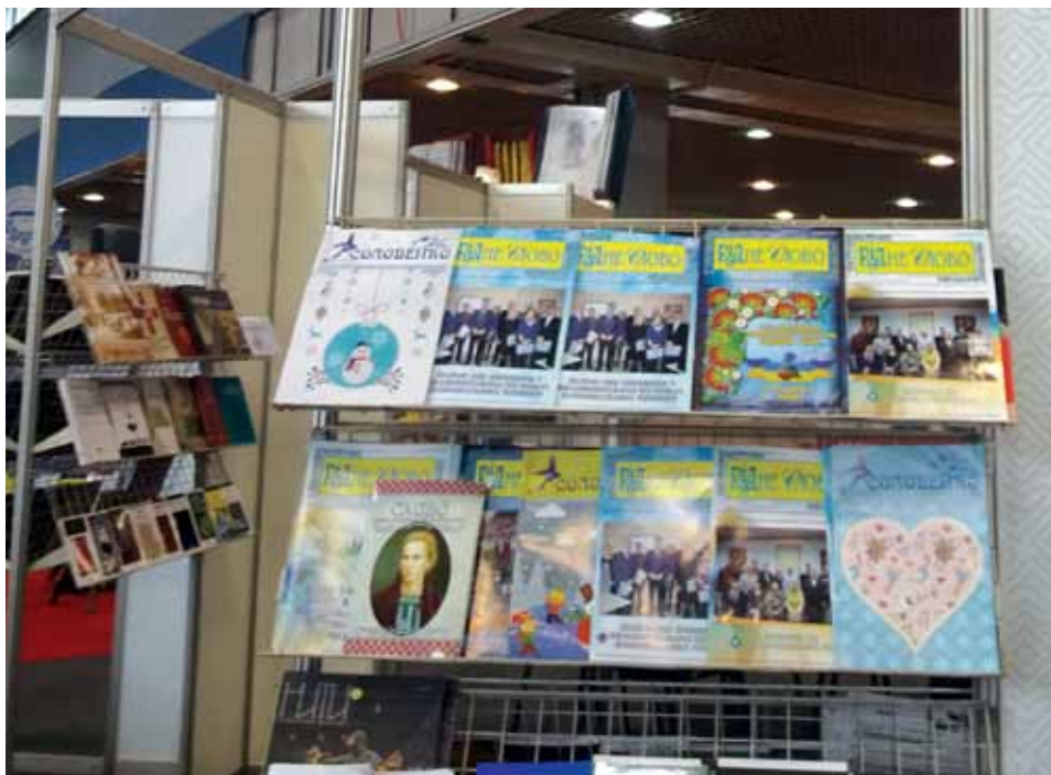
Стенд з виданнями ГВУ «Рідне слово» на Міжнародному ярмарку книг в Новому Саді

Участь на Міжнародному ярмарку книг є дуже важлива для всіх видавництв, так як тут можна поспілкуватися з читачами, ознайомитися з другими виданнями з відповідною тематикою та взяти участь в презентаціях і круглих столах.