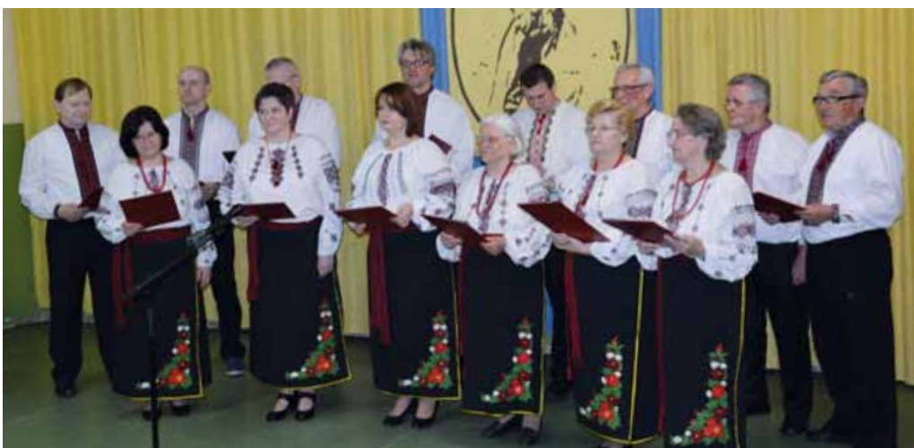
Мішана вокальна група КМТ ім. Івана Сенюка