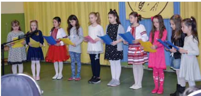
Дитяча вокальна група КМТ ім. Івана Сенюка