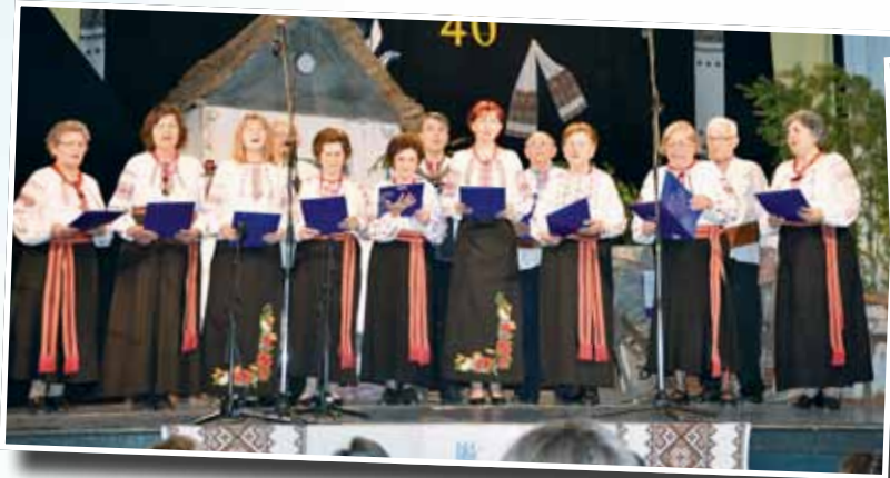
Джерельна співоча група ТПУК «Коломийка»