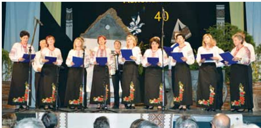
Мішана вокальна група ТПУК «Коломийка» (Сремська Мітровица)

група, солісти і декламатори ТПУК «Коломийка», а у другій частині програми виступили гості.