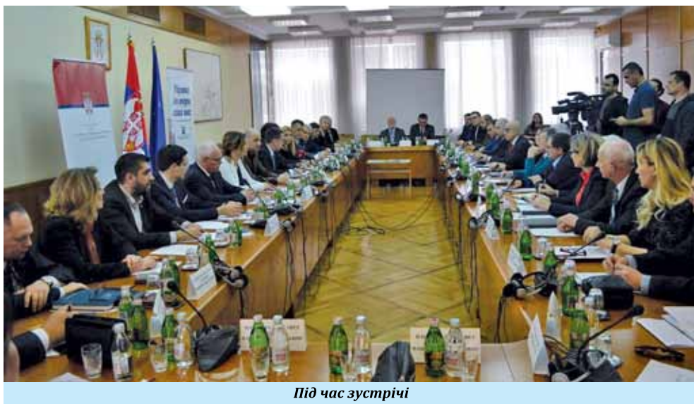
Під час зустрічі

Виділення коштів здійснюватиметься Управлінням з прав людини і меншин, а національні ради зобов'язані подати пропозиції про виділення коштів до 1 квітня 2019 року, зазначено на зустрічі.