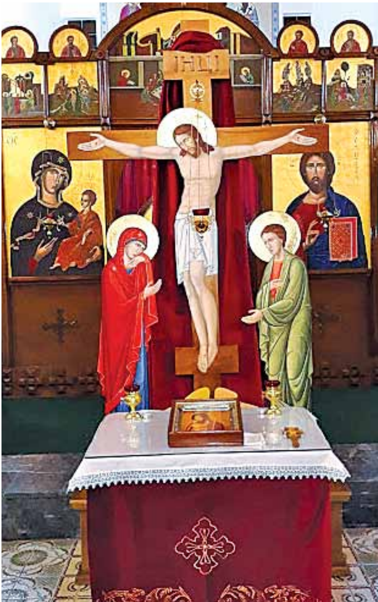
Ікона «Розп'яття» на парафії св. свцм. Йосафата у Кулі