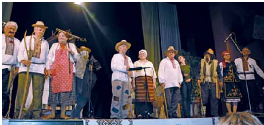
Вистава «На перші гулі» у виконанні драмгуртку КПТ «Карпати» (Вербас)