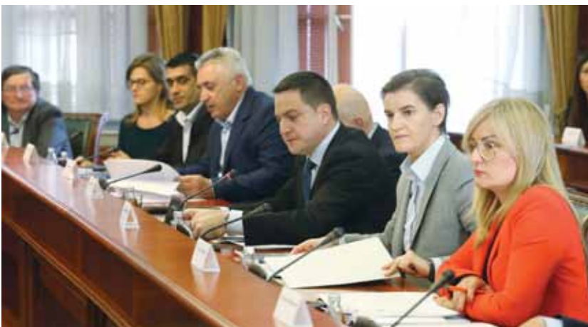
Під час засідання Ради національних меншин

Міністр державного управління та місцевого самоврядування Бранко Ружич зазначив, що Рада