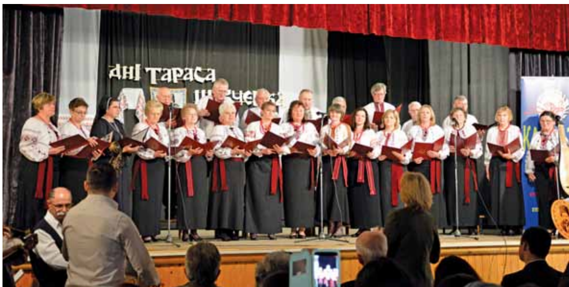
Хор КПТ «Карпати»