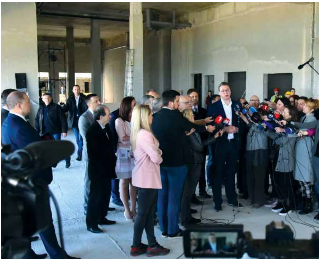
За време посете председника Србије Александра Вучића

Уз остало, запосленима ће на располагању бити пет телевизијских и шест радијских студија из којих ће се програм, поред српског, емитовати на 15 језика националних мањина, а међу њима и на украјинском језику.