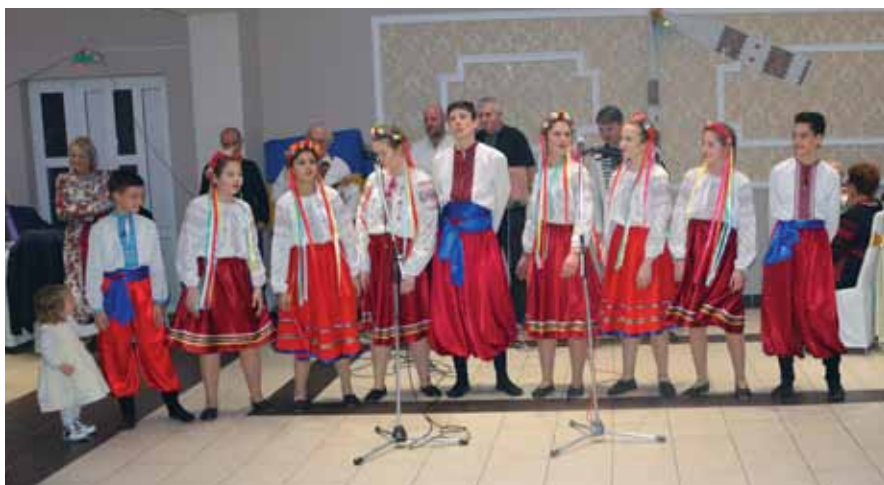
Дитяча вокальна група УКМТ «Калина»