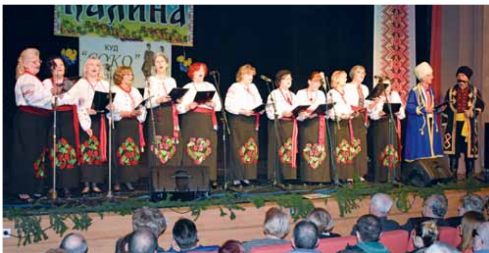
Мішана вокальна група УКМТ «Калина»

всім пісня «Маруся раз, два, три калина» і об'єднала всіх присутніх, які співали разом.