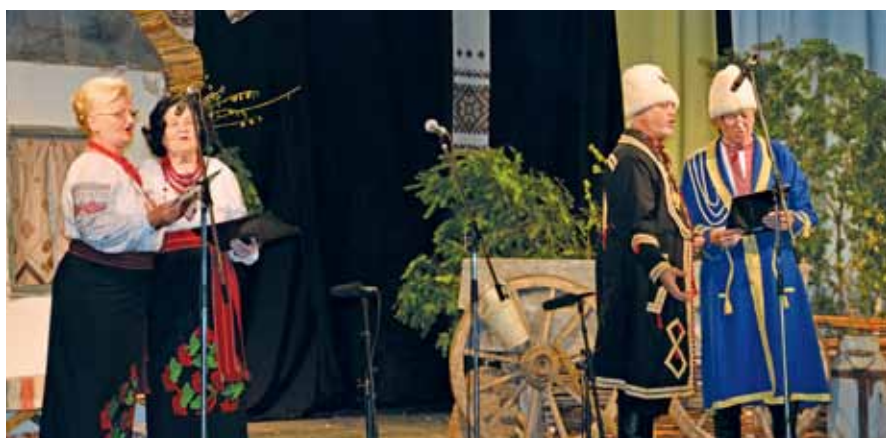
Вокальний квартет УКМТ «Калина» (Інджія)