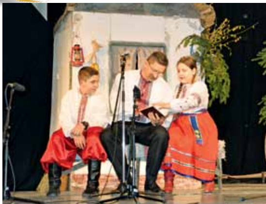
Мистецька сценка присвячена творчості Т. Шевченка