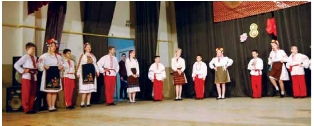
Святкова програма з нагоди Дня 8 Березня у КПТ «Карпати»

Також в Товаристві «Карпати» з Вербасу, в середу