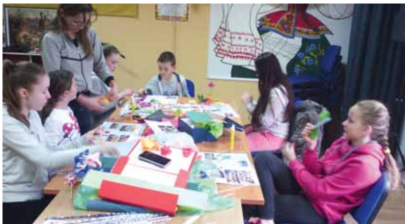
Майстер-клас присвячений Міжнародному жіночому дню – 8 Березня у УКЦ «Кобзар»

Участь в майстер-класі взяли наймолодші члени